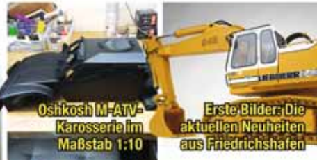
Oshkosh M-ATV- Karosserie im Maßstab 1:10