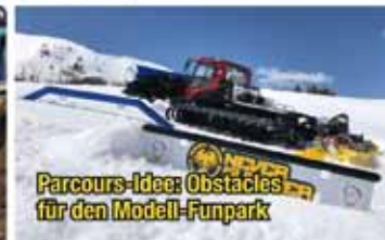
Parcours-Idee: Obstacles für den Modell-Funpark