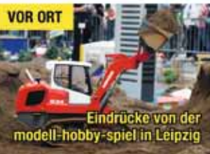
Eindrücke von der modell-hobby-spiel in Leipzig