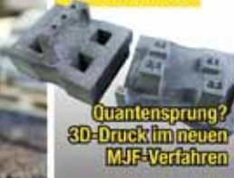
Quantensprung? 3D-Druck im neuen MJF-Verfahren