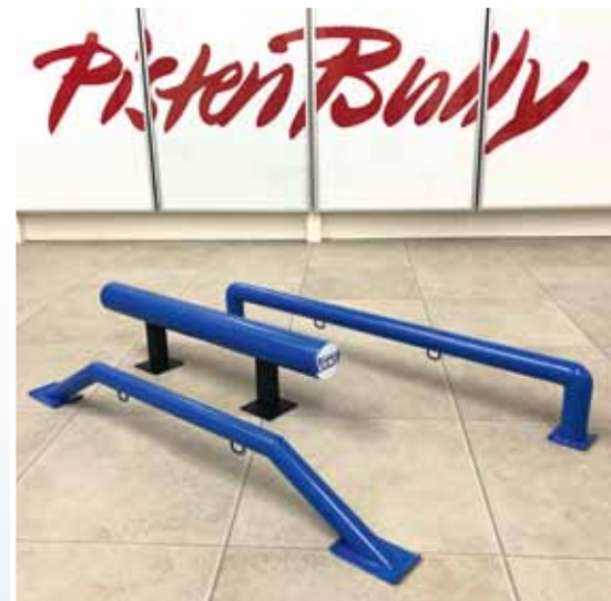
Fertige Obstacles: vorne ein Industry Trannyfinder, in der Mitte ein Hovertube und hinten eine Industry Flatrail

Rohr verklebt. Die Bodenplatten bestehen aus 1-Millimeter-Alublech mit aufgebogenen Enden. Beim Flatrail habe ich an den Bodenplatten für eine stabile Verklebung Kunststoffzylinder angebracht und zusätzlich mit einer Senkkopfschraube gesichert. Mit dem Zweikomponenten-Epoxykleber kann man übrigens auch sehr schön die Schweißnähte des Originals nachempfinden.