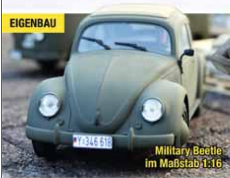
Military Beetle im Maßstab 1:16